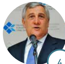
Federica Mogherini Înaltul Reprezentant al Uniunii pentru afaceri externe și politica de securitate și vicepreședinte al Comisiei